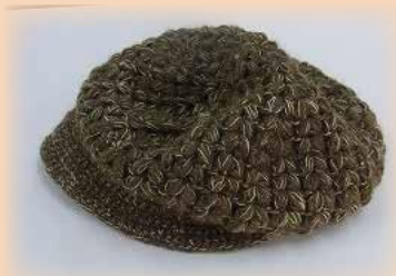
ヤママユの糸を編み込んだ帽子