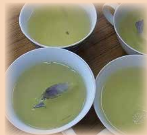
スイレンの花びらもかわいいお茶