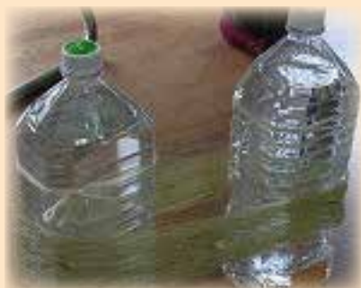
ペットボトルから糸が外れないよう に工夫しました

ゴールデンウィーク最中でしたが、6名の参加でした。先月に続き、やままゆの糸をカセの状態から、糸繰り機にかけ、玉巻きにする作業をしました。