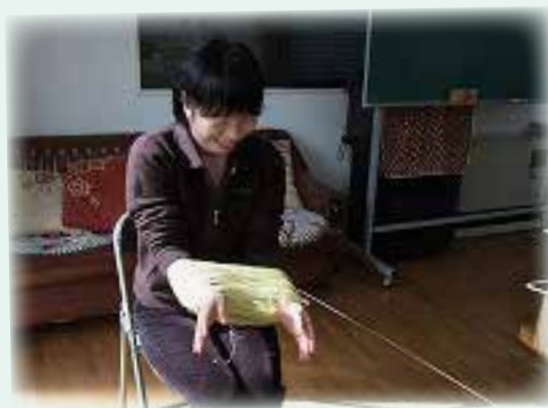
昔の子どものお手伝い、懐かしい風景ですね