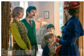
ジェーン（姉）、マイケル（弟）、子供たち、メリー・ポピンズ