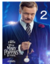
フェデリコ銀行の頭取 : Colin Firth 時刻を見ている