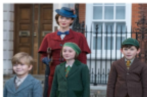
バンクス家の3人の子供たち