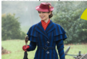
メリー・ポピンズ : Emily Olivia Leah Blunt