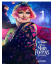
メリーの従姉妹で修理屋のトプシー : Meryl Streep