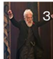
元頭取が現れ銀行の役割を話す